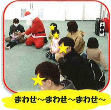
まわせ～まわせ～まわせ～