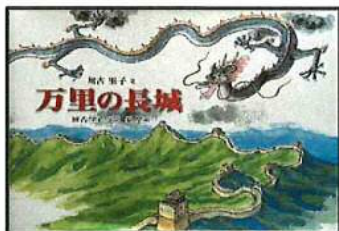
参考絵本:「万里の長城」福音館書店 © 2011 かこさとし

今年の干支は「辰」です。正確には「甲辰」といいます。十二支の先頭から数えると5番目になります。干支のルーツは中国殷の時代にあるといわれています。十二支は、年神様の話を聞いた動物たちが、1月1日の朝、神殿にやってきた順に、1年ずつその年を任されるようになったという話があります。辰(龍)は唯一架空の動物ですが、古来より中国では権力の象徴とされ、縁起の良い生き物といわれています。その為、神話や民話によく登場します。干支を広く浸透させるために縁起の良い龍を選んだのかもしれないですね。