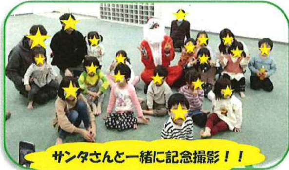
サンタさんと一緒に記念撮影！！