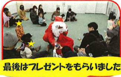
最後はプレゼントをもらいました！