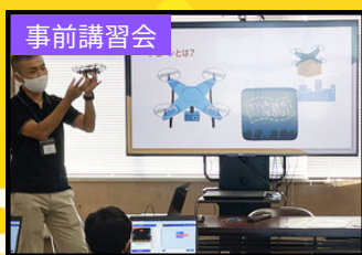
事前講習会に参加して、プログラミング体験をします。