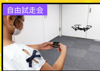
本番と同じコースでドローンを飛ばして練習します！