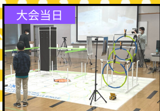
ドローンをいかに制御できるかをチームで競います。