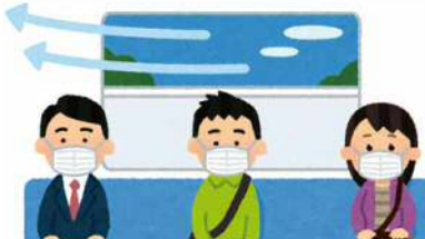
車内や駅構内の換気や消毒