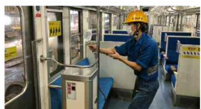
車内の抗ウイルス抗菌加工