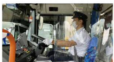
運転席への感染防止シート設置

公共交通機関は、新型コロナウイルス感染拡大予防ガイドラインに基づき、徹底した感染予防に取り組んでいます。