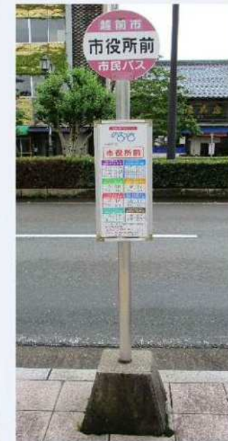
Ponto de ônibus Norossa