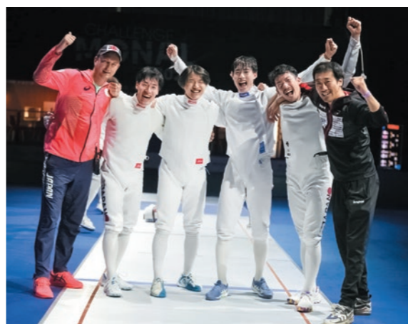
▲フェンシングワールドカップ(5月19日フランス)勝利を喜びチームメンバー

個人でも団体でも、複数のメダルが狙えると感じています。オリンピック期間中はぜひ、エペはもちろん、フェンシング全体から目を離さず応援してほしいです。