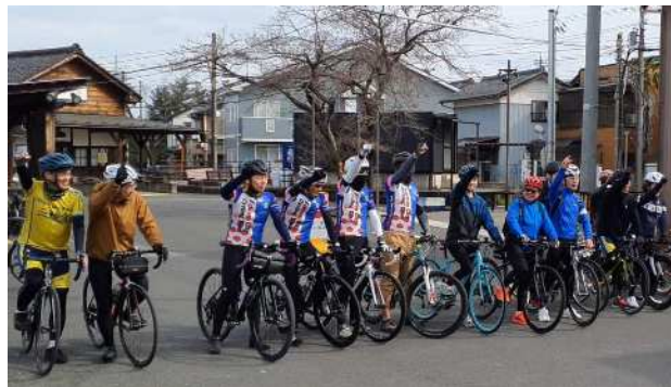
自転車を利用したイベント