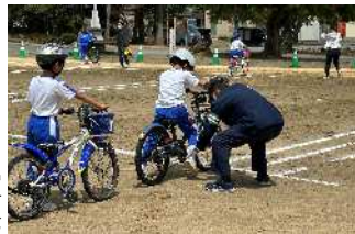
交通安全教室 ヘルメット着用の啓発