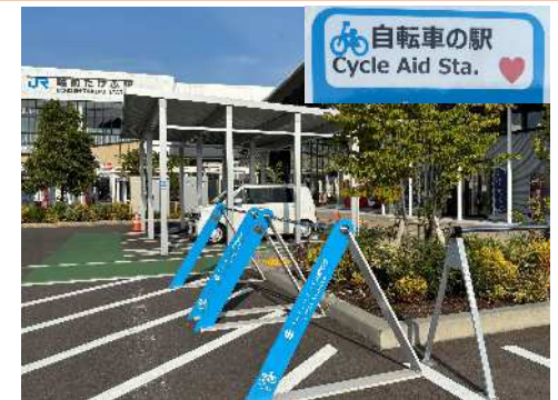
自転車の駅の設置