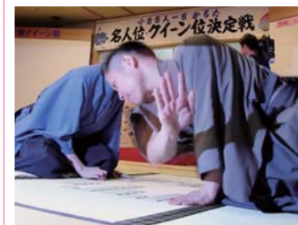
名人位決定戦の様子(滋賀県 近江神宮)

この栄誉をたたえ、市は1月28日に市民スポーツ文化大賞を贈りました。今後ますますのご活躍をお祈りします。