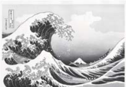
▲葛飾北斎「神奈川沖浪裏」