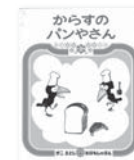
「からすのパンやさん」 (かこさとし/作・絵 福成社刊 1973年)