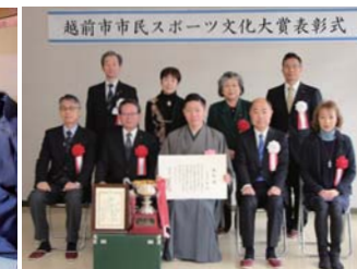
市民スポーツ文化大賞表彰式の様子