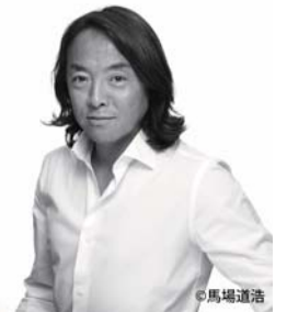
きたざわ つよし 北澤 豪 さん