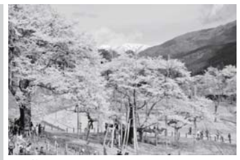
樹齢1500余年の天然記念物指定 根尾谷「淡墨桜」