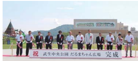
武生中央公園 だるまちゃん広場 完成式典（平成29年8月11日）

新年明けましておめでとうござい ます。 市民の皆さまには、「健勝にて輝 かしい新春をお迎えのこととお慶び 申し上げます。 また、旧年中は市政の推進にご支 援とご協力をいただき、厚くお礼 申し上げます。 さて、平成17年11月の市長就任以 来、私は「現地現場主義」をモットー に、「自立」と「協働」のまっちゅり を進めてまいりました。