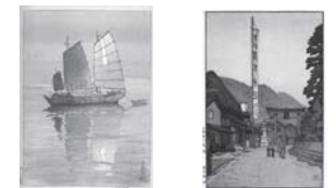
▲吉田 博「帆船 夕日」 ▲吉田 遠志「岡太神社」