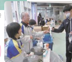
ドリンクサービスでおもてなしを 行うボランティアの皆さん