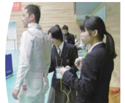
競技の運営に携わる高校生の 皆さん