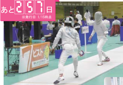
女子サーブル団体で、ベスト4入りの活躍を 見せた「福井クラブ」（写真・右側）