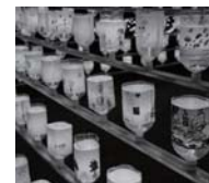
▲ペットロボイルミネーション

人形劇「3匹のこぶた」 ● とき / 2月3日(土) ● 午前11時~正午 ● とら / 夢みらい館・さばえ ● 対象 / 親子50組 (小学校低学年以下) ● 申込締切 / 1月25日(木) ● ※託児有(要申込) ● 問合せ / 夢みらい館 さばえ ☎5111722