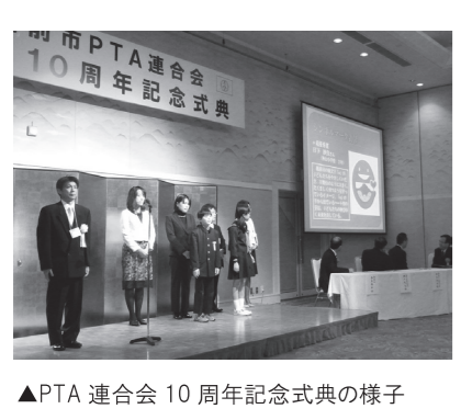
▲PTA 連合会 10周年記念式典の様子