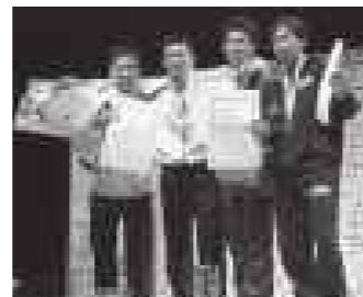
全日本選手権大会での表彰式。厳しい戦いを勝ち抜き、結果を表彰される何よりも嬉しい瞬間(見延選手：左から2番目)