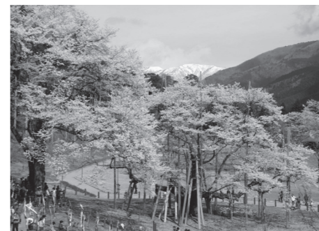
▲樹齢1500余年の天然記念物指定 根尾谷淡墨桜

■参加費／9200円(昼食付) ※越前市友好都市推進協議会から費用の一部が助成されています。