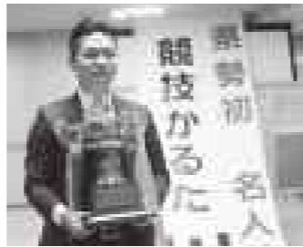
念願のタイトル「名人位」のトロフィーを手に。名人位獲得による慢心は、その表情からも一切感じられません