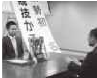
越前市役所に掲げられる懸垂幕をバックに。奈良市長に勝利の報告を行いました。