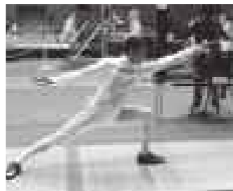
ヨーロッパでは大人気のフェンシングエペ。思わず息をのむ、美しいフォームでひと突き!