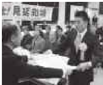
越前市の「市民スポーツ文化大賞」を受賞した時の模様。受賞後、越前市ふるさと大使の委嘱式も行われました。

残すところ後3試合、それで全てが決まります。残された期間は3ヶ月。チーム一丸となり1日も無駄に過ごす事のないように、残された期間を突っ走りたいと思います。この4年間、切磋琢磨してきた仲間、日本チームの絆を大切に、最高の結果を出したいです。そして、オリンピックの舞台でも、皆さんの期待に応えられるよう、実力の全てを発揮したいと思います！」