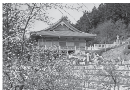
▲梅の花が咲く、紫式部ゆかりの石山寺(イメージ)

■参加費／大人 12800円 小人(小学生) 10800円 ※幼児をお連れの場合は、予約時にお申し出ください。別途料金が必要な場合があります。