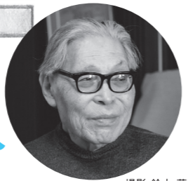
撮影 鈴木 藍 2014年2月

子どもが社会人に成長するには、学校と家庭での指導教育と共に、子ども自身の生きる力が必要です。子はハイハイからやがて体各部を自由に使えるようになります、仲間と声をあげて遊び、気に入った事に夢中になります。この間知恵と経験を蓄え、豊かな心と生きる力が備ってゆきます。この子ども時代をたっぷり過せるよう、この絵本館がお役に立つよう願っています。