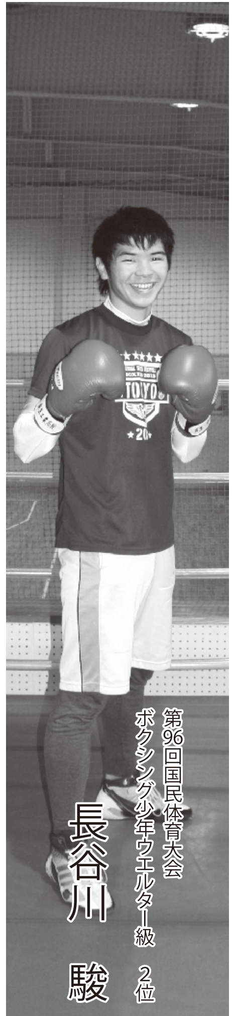
第96回国民体育大会 ボクシング少年ウエルター級 2位