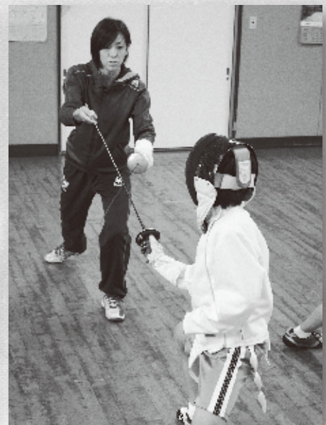
▲フェンシングの指導風景