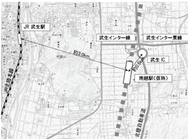
▲北陸新幹線南越駅(仮称)の位置