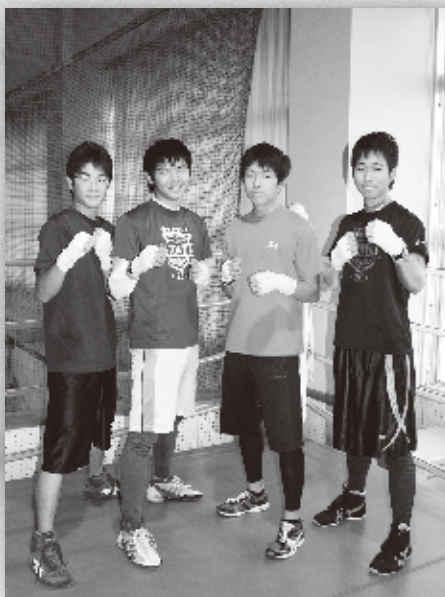
▲同学年のチームメイトと