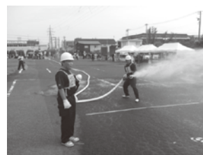
自警消防隊連合会 夏季合同訓練