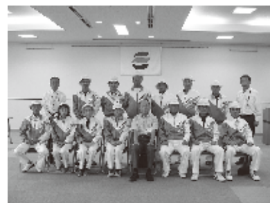
第27回全国健康福祉祭出場者激励会