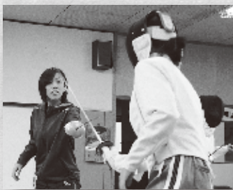
▲指導にも熱が入る