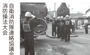
自衛消防隊連絡協議会 消防操法大会