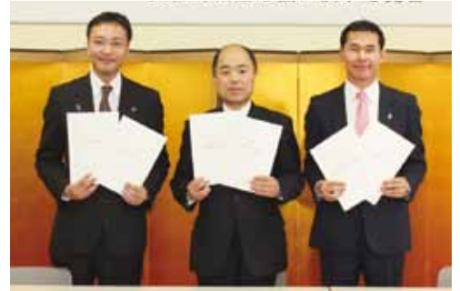
▲調印式の様子(左から三条市長、越前市長、関市長)

市では今後、共通の地場産業の振興と、併せて観光振興やまちづくりなどの分野で幅広く連携し、まちづくりに繋げていきます。