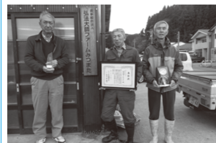
▲表彰を受けた弘法大師ファームみつまたの皆さん

三ツ俣町、横根町、北山町、丹生郷町にある30戸の兼業農家で構成している農事組合法人弘法大師ファームみつまたが、良質なそばを生産する模範的な生産集団を表彰する全国そば優良生産表彰事業において、「一般社団法人日本蕎麦協会会長賞」を受賞しました。今回の受賞は、平成30年産のそばの生産において、新たな機械・技術の積極的な導入や全ての圃場で無農薬・無化学肥料栽培を実施した取り組み等が高く評価されたものです。