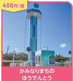
400円/回 かみなりまちの ほうでんとう