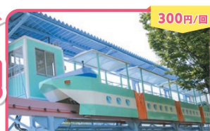
300円/回 かみなりまちのモノレール