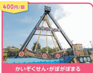
400円/回 かいぞくせん・がぼがぼまる