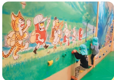
▲どんどこんのおへや