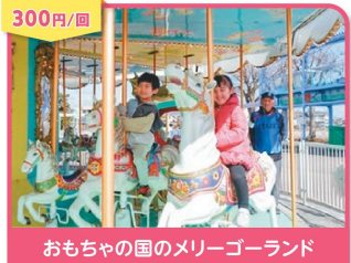
300円/回 おもちゃの国のメリーゴーランド

■今年度の運行期間は 3/1(日)~6/28(日)・9/5(土)~11/29(日) ※土日・祝日のみ