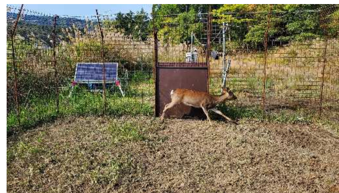
▲罠(檻)にかかったシカ