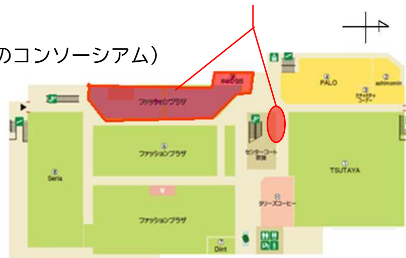
▲武生楽市 2階フロア