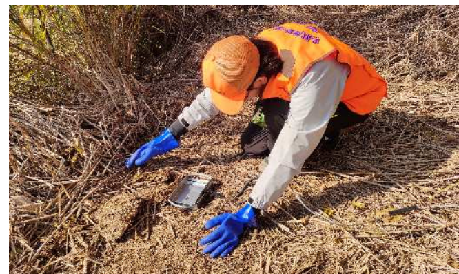
▲くくり罠設置の様子