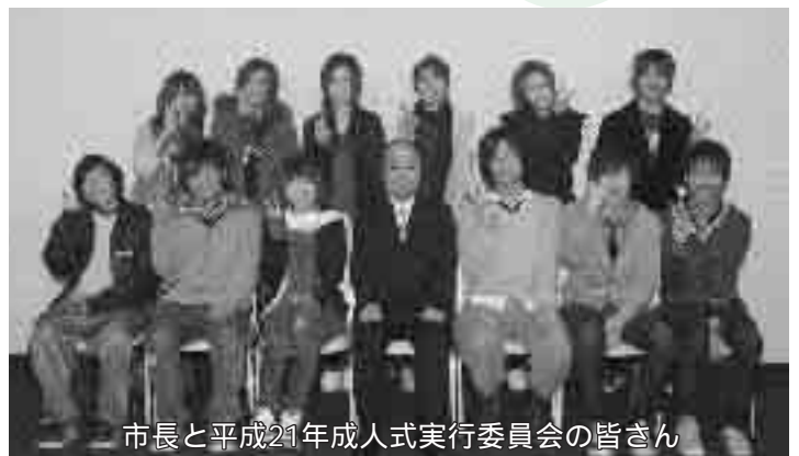
市長と平成21年成人式実行委員会の皆さん