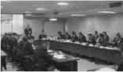
昨年12月に行われた緊急経済・雇用対策会議の様子

原油や原材料などの高騰による市民生活などへの影響を踏まえ、7月には「市原油等価格高騰対策会議」を、また世界的な景気後退に伴い本市の経済情勢も一気に悪化したことから、10月には市緊急経済・雇用対策会議を設置し、国や県の経済対策と整合を図りながら、市独自の緊急経済・雇用対策事業の推進を図っています。