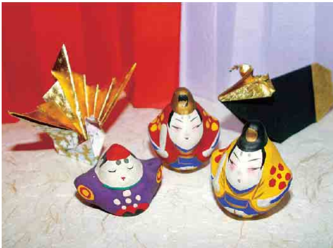
■冬の館蔵品展「天神さん」より (武生公会堂記念館で公開中)