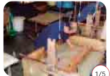
卯立の工芸館「越前和紙漉き初め」

1/1 権現山の峰に湧き出る初水を漉き舟に分けた後、伝統工芸士達が、今年1年の繁栄を願い、「越前和紙漉き歌」にあわせて、塵より・紙出し・紙漉きなどの各工程を行いました。