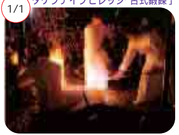
タケフナイフビレッジ 古式鍛錬

1/1 年明けと同時に、親方・子方の3人が鉋を使って刃物を作る古式鍛錬技法を再現しました。