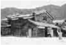
▶登録文化財に指定された卯立の工芸館