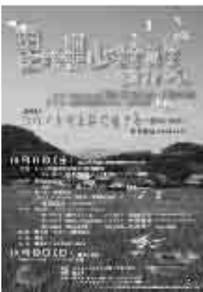
里地里山保全再生全国フォーラム in 越前のポスター

全国で里地里山の保全再生に取り組んでいるNPOや自治体関係者などが集まり、「水辺と生き物を守る農家と市民の会」の主催(市は共催)で「里地里山保全再生全国フォーラム in 越前」が坂口地区を中心に開催されました。 全国初の開催で、今後の元気な里地里山保全再生活動に大きくつながっていくことが期待されます。