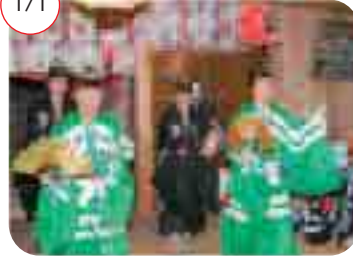
味真野神社「越前万歳奉納」

1/1 千四百年の歴史があるとされる越前万歳は、味真野神社で舞を奉納した後、観客を前に、厄よけと家の発展や、長寿を祈る曲などを軽快に舞い踊りました。