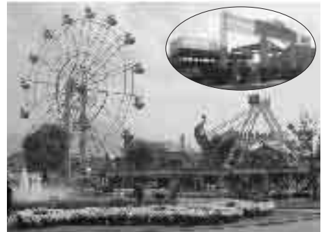
菊人形開園中の公園内

僕は、学校祭などの運営にも長く携わってきたので、自分の経験を生かして、菊人形をもっと盛り上げる企画などを考えて提案できないかなあと考えています。