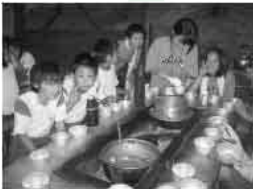
子ども会活動の様子