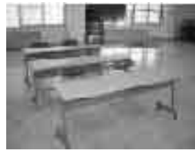
・西地区自治振興会 会議用机30台、折りたたみ椅子60脚、 収納台車3台を購入