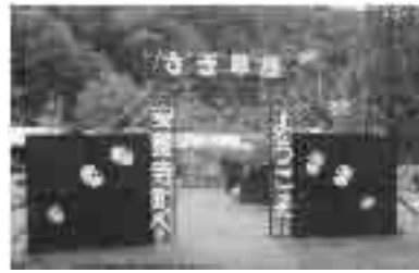
さぎ草王国の取り組み(さぎ草展)

また、この訓練に合わせ、今立地区に整備した、同報系防災行政無線も訓練で一役を担いました。