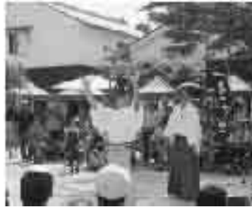
大勢の人で賑わう市の

平成19年11月に国から認定を受けた「中心市街地活性化基本計画」に基づき、住みよい、賑わうまち