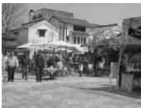
「壱の市」で賑わう蔵の辻

このほか、10年後の食と農のあるべき姿を示す「食と農の創造ビジョン」の策定、地域住民の生活の足を確保する福井鉄道福武線の存続への支援、全国の里地里山の保全活動に取り組む人たちの情報交換などを行った