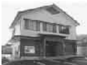
・余田町 余田町公民館を新築

(勸)自治総合センターが実施しているコミュニティ活動支援のための宝くじ助成金を受け、以下の事業が行われました。