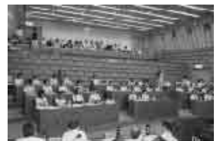
▼子ども議会の様子