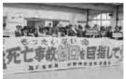
交通死亡事故ゼロ500日達成式の様子