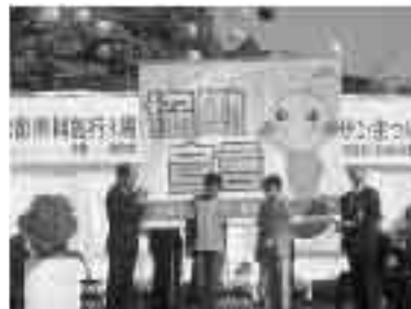
3周年記念式典で行われた「協働キックオフ宣言」の様子

典では、協働のさらなる推進を図る決意を込めて、市民の代表が「協働キックオフ宣言」を行