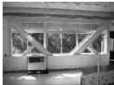
耐震化を終えた坂口小学校の校舎内