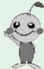
▲協働のマスコット「たねまる」