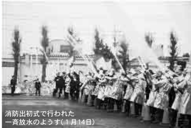
消防出初式で行われた一斉放水のようす(1月14日)

火災の多くは、不注意によるものです。一人ひとり日ごろから防火の意識を持ち、火災を起こさないよう心がけましょう。