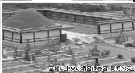
墓地の中央の墳墓は総墓「閑月の苑」