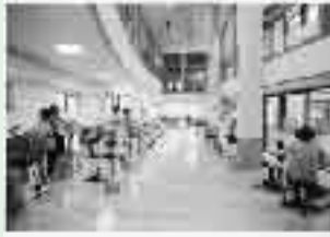
▲マシンも充実しています