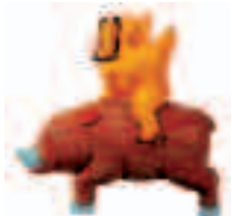
伏見人形「猪乗り狐」