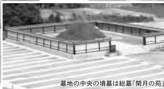
墓地の中央の墳墓は総墓「閑月の苑」