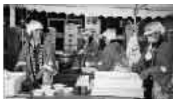
▲はっぴ(西地区自治振興会)

念願の備品がそろい、納涼祭は両地 区とも大変盛り上がり、地域の人たち にも喜ばれました。 ※このほか、宝くじの収益金は広く地 域づくりに役立てられています。