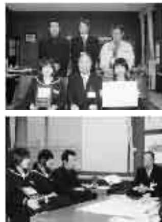
奈良市長に受賞の報告をしました。

昨年11月28日に開催された環境省・ 日本鳥類保護連盟主催の「第41回全国 野生生物保護実績発表大会」で、武生 第五中学校が林野庁長官賞を受賞しま した。 平成16年に環境省の「里地里山保全再 生モデル事業」実施地域に選定されたの を機に、自然環境の素晴らしさを学び 守っていく活動を始め、これまでに希 少生物の生息分布地図・生物カードの 作成、ダム建設予定地の植物保護、「冬 みずたんぼ」の生き物調査など、数々の 調査や保護作業に取り組んできました。 「里地・里山づくり」は、とても大事 なこと。後輩たちにもこの活動を継続 していつてほしい。そして、より多く の人たちに自然を守ってもらえるよう 啓発活動を続けていきたい」と生徒ら は抱負を語りました。