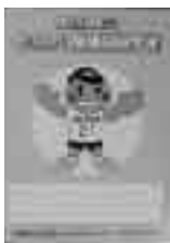
▲「わたしの健康記録手帳」