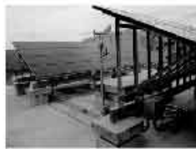
越前市市民図書館電気(取付社)工 屋上設置太陽光発電システム