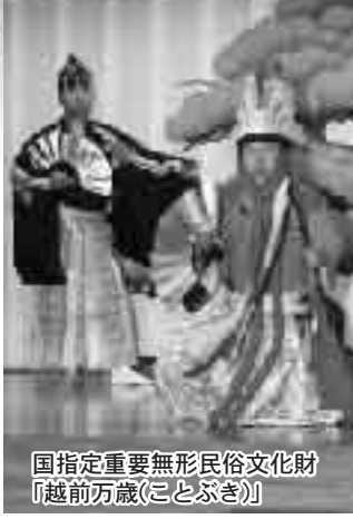
国指定重要無形民俗文化財「越前万歳(ことぶき)」

新しい年を迎え、皆さんは「今年も幸多かれ」と門松や注連飾りをし、神社に初詣をしたりするでしょう。昔はそれに万歳師たちが軽やかに太鼓を叩きながら各家々へ祝福にやってきました。越前万歳は加賀の金沢・大聖寺、越前では福井をはじめ大野・勝山などの各藩のご城下を祝福して回りました。この越前万歳の発祥の地が味真野です。今ではほかの地域へ出かけることはありませんが、毎年一月一日に味真野神社と味真野商工会館で初舞奉納を