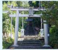
1 高志前放神社 (矢野町) 神武天皇の御、大嘗会が北陸道の行の御、御時を経てから来て御魂が降った場所と伝説と受け継がれています。御魂に守護石の高輪が降る、御魂の魂を神と本願になります。