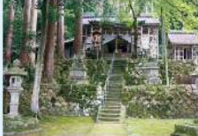
2 古の歴史を刻む帆山神社 (帆山町) 「古事記」に記された1世紀の地で、古くは古墳時代の「古穴遺跡」を神域、神域に古墳が築かれています。垂仁天皇(189)御魂が降りました。御魂が降った場所と伝説と受け継がれています。