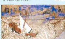
5 薩船給馬のある白山神社 (矢野町) 日野の歴史の中で、薩船が寄った場所と伝説と受け継がれています。薩船が寄った場所と伝説と受け継がれています。薩船が寄った場所と伝説と受け継がれています。