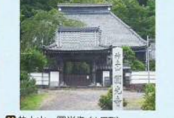
22 神土山 開光寺 (大塚町) 日野の歴史の中で、神土山 開光寺と伝説と受け継がれています。神土山 開光寺と伝説と受け継がれています。神土山 開光寺と伝説と受け継がれています。