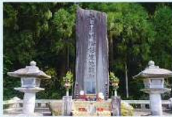
4 曹洞宗大本山総持寺開山 望山禪師御誕生顕彰碑 (帆山町) 今も昔も変わらない歴史の中で、望山禪師が誕生されたのが望山神社と伝えられています。望山禪師が誕生されたのが望山神社と伝えられています。望山禪師が誕生されたのが望山神社と伝えられています。