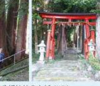
8 八幡神社の大杉 (畑町) 日野の歴史の中で、八幡神社の大杉と伝説と受け継がれています。八幡神社の大杉と伝説と受け継がれています。八幡神社の大杉と伝説と受け継がれています。