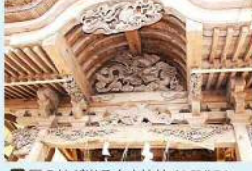
12 匠の技が光る白山神社 (小野町) 日野の歴史の中で、匠の技が光る白山神社と伝説と受け継がれています。匠の技が光る白山神社と伝説と受け継がれています。匠の技が光る白山神社と伝説と受け継がれています。