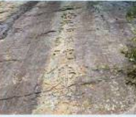
7 絶壁に建つ摩崖仏 (向新保町) 大正時代に建てられた摩崖仏は、崖に削り出されたもので、絶壁に建つ摩崖仏と伝説と受け継がれています。絶壁に建つ摩崖仏と伝説と受け継がれています。絶壁に建つ摩崖仏と伝説と受け継がれています。

北日野公民館 〒915-0052 越前市矢野町 21-11 TEL/FAX: 0778-23-4600 Mail: kitahino_ko@city.ehizen.lg.jp 令和5年3月製作 表紙イラスト: 西嶋小夏 マップ情報(公共施設): 万葉中学校美術部 印刷: 新アプロセンターホープ