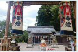
15 愛宕神社 (平林町) 日野の歴史の中で、愛宕神社と伝説と受け継がれています。愛宕神社と伝説と受け継がれています。愛宕神社と伝説と受け継がれています。