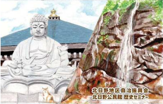
北日野地区自治振興会 北日野公民館 歴史セミナー