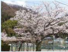
3 継体天皇お手植えの薄墨桜 (帆山町) 帆山町から車で約30分、継体天皇の御魂が降った場所と伝説と受け継がれています。継体天皇の御魂が降りました。御魂が降った場所と伝説と受け継がれています。