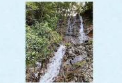
13 山椒魚が生息する荒谷の滝 (飛谷町) 日野の歴史の中で、山椒魚が生息する荒谷の滝と伝説と受け継がれています。山椒魚が生息する荒谷の滝と伝説と受け継がれています。山椒魚が生息する荒谷の滝と伝説と受け継がれています。