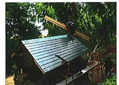
2013年 史跡保存活動 により古い屋根を直す