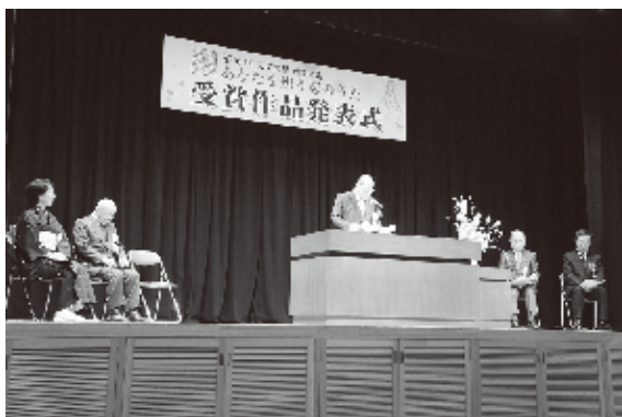
昨年の「万葉の里・短歌募集 あなたを想う恋のうた」受賞作品発表式の様子

毎年、国内外から2万首を超える応募が寄せられており、本事業を通じ、若者の文芸振興のみならず、本市の歴史・文化情報を広く全国に発信・PRされた功績は大きい。