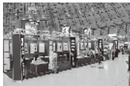
越前モノづくり フェスタ2014

宝くじの社会貢献広報事業として宝くじ助成金を活用し、「越前モノづくりフェスタ2014」を開催しました。フェスタは、9月13日から15日の3日間、サンドーム福井にて、多様な企業のPR、多彩なイベントにより、多くの来場者で賑わいました。