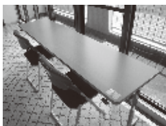
王子保地区自治振興会 折りたたみ椅子・机

宝くじの社会貢献広報事業として宝くじ助成金を活用し、自治振興会がコミュニティ活動に必要な備品を整備しました。各種行事で利用され、地域活性化に役立っています。