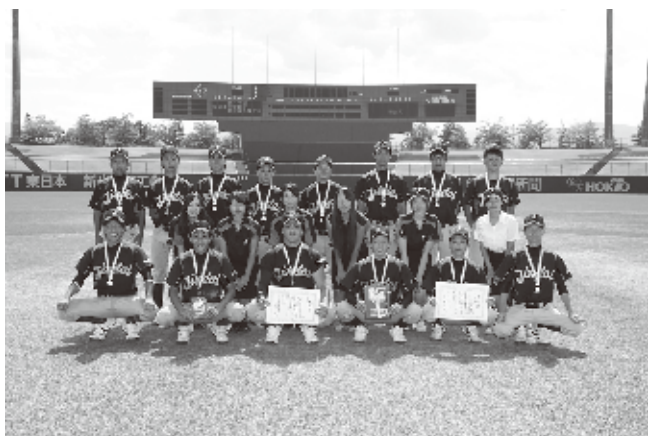
仁愛大学 軟式野球部員の皆さん

持ち前のチームワークを生かし、本年、250校を超える加盟チームの頂点を決める全日本大学軟式野球選手権大会において、飛躍的な活躍を遂げ、「全国準優勝」という栄冠を掴まれた。