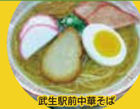
武生駅前中華そば