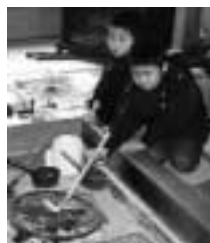
▶いろいろでかき餅焼き体験の様子