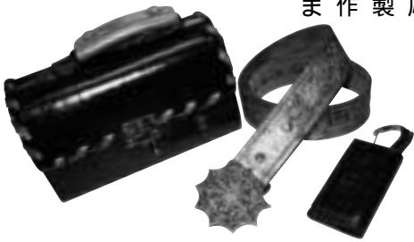
漆を使った様々な製品

たとえば、柱や家具といった木材を始め、和紙・皮革・金属といった、今までの常識からは想像もつかない材料を漆や、蒔絵と融合することで、全く新しいものを生み出してきました。と思っています。