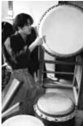
▶「ごぼつ太鼓」の様子

当日は、神事や「ごぼつ太鼓」の演奏が行われた後、お膳に、約2キロの山盛りのごぼつの味噌和えと、約5合のご飯を高く盛った、物相飯などが並べられ、祝杯が交わされました。 参加した町内のみなさんは、山盛りのごぼつを豪快に食べ、お酒を飲み交わしながら、楽しそうに親睦を深めています。