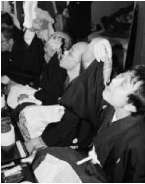
▲ごぼつを豪快に食べる参加者の皆さん

「ごぼつ講の起こりは定かではないようですが、ごぼつ講が始まった江戸当時に、農民たちが領主の厳しい年貢の取立てに負けないよう、村人の団結強化を目的として、ごぼつを中心にした料理を食べたことが始まりだといわれています。