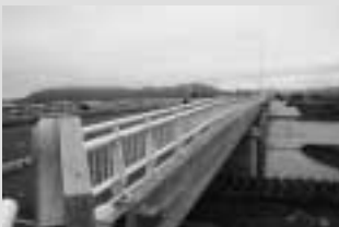
▲まもなく完成する府中大橋

建設が進んでいる戸谷片屋線の「日野川に架かる」府中大橋がこのほど完成し、3月21日午後3時から一般に向け開通します。 これにより、吉野地区方面から国高地区方面への東西のアクセスが強化され、安全で円滑な自動車交通が確保されます。