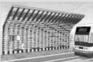
▲スポーツ公園駅の完成予定図

3月25日には、福武線に新しく「スポーツ公園駅」が開業します。 また、駅の名称も「武生新駅」が「越前武生駅」に、「西武生駅」が「北府駅」に変更するほか、朝の急行電車の増発や、終電の繰り下げ運行などダイヤ改正も行われ、より利用しやすくなります。