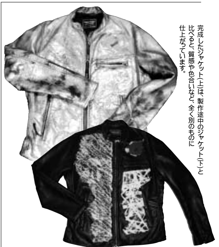
完成したジャケット(上)は、製作途中のジャケット(下)と比べて、質感や色合いなど、全く別もの仕上がっています。

また、和紙の素材感が、本来の生地と一体となり、なめらかな表面に荒々しさを与え、今までにならぬ、おもしろい質感・デザインになっていくと思っています。