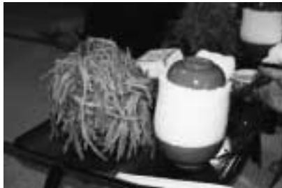
▶山盛りのごぼつ、物相飯