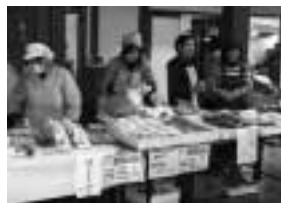
▶特産加工品の販売の様子

また、もやいの里・農楽園では、布ぞうり作りやもちつき体験、きな粉挽き体験など、昔ながらの田舎の暮らしを体験する多数のプログラムが準備されたほか、特産加工品の販売やもやい鍋も振舞われ、大勢の家族連れで賑わいました。