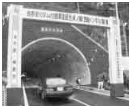
開通式の後、通り初めをする車

福井県が平成13年度に着工し整備が進められていた吉野瀬川ダム付け替え県道武生米ノ線が、瀨川ダム付け替え県道武生米ノ線が、広瀬町から小野町間2795mにおいて、トンネル部(笠倉トンネル)を含め竣工し、開通しました。 この道路は、吉野瀬川ダムの建設により水没する県道の代わりに整備しているもので、広瀬町から勝蓮花町まで全長4477mの約6割が完成したことになります。 今後、ダム本体の工事に着工し、2018年の完成を目指します。