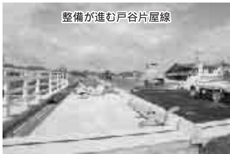
整備が進む戸谷片屋線