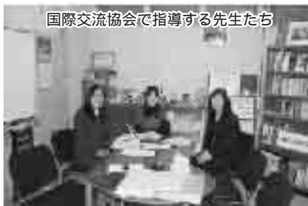
国際交流協会にて指導する先生たち