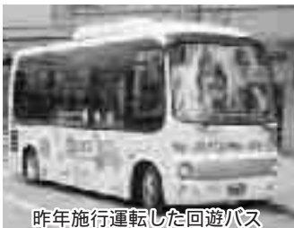
昨年施行運転した回遊バス

また、昨年試行した、観光イベントエリアをつなぐ観光回遊バスを6日間、無料運行します。