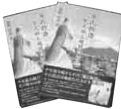
「源氏物語 紫式部と越前たけふ」福嶋昭治著(園田学園女子大学教授)

この本は、市内の書店や図書館などで一部1500円で販売されており、その収益は、紫式部顕彰会が5月から5年間かけて開催する「源氏物語54