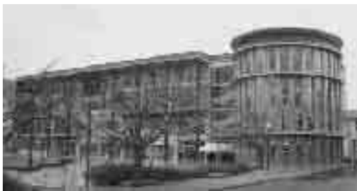
新設された人間生活学部 の学棟

仁愛大学に、新たに「人間生活学部」が創設され、学部棟が完成し、総合大学としてさらに充実しました。 学部には、「健康栄養学科」と「子ども教育学科」があり、「健康栄養学科」では、医療・福祉・地域・教育の場などで活躍する管理栄養士の育成を目指し、管理栄養士や栄養教諭 第一種免許などが取得できます。 また、「子ども教育学科」では、子どもの生きる力と学ぶ意欲を育てる教育者の育成を目標し、幼稚園・小学校教諭一種免許や保育士資格などが取得できます。