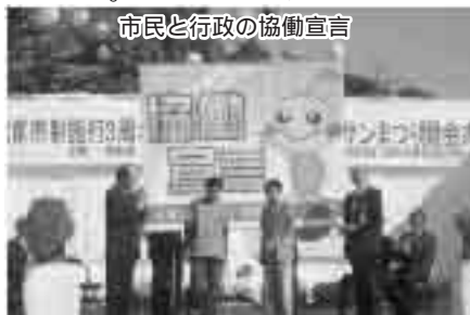
市民と行政の協働宣言

区長会連合会と自治振興会連合会が統合し、自治連合会が設立されることで、さらに地域自治の推進を図り、自治振興会の活動を支援します。