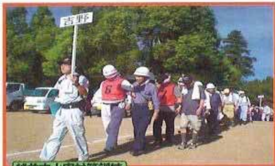
越前市水害対策訓練

日 時 : 2011年4月17日(日)午前9時 会 場 : 吉野公民館 2階ホール