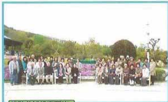
環路花博視察研修