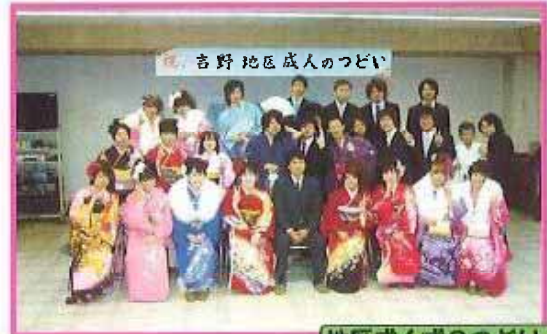
地区成人式のつどい