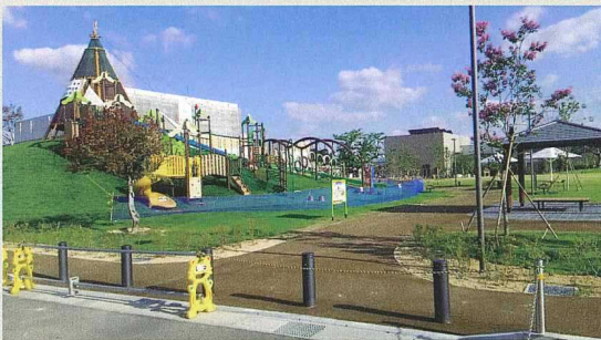
中央公園(こども広場)