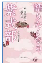
『語りたくなる紫式部』 吉井美弥子/監修