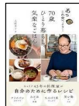
『あっこれ食べよう!70歳ひとり暮らしの気楽なごはん』 大庭 英子//著