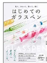
『はじめてのガラスペン』 武田 健/著