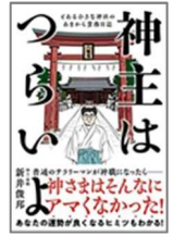
『神主はつらいよ』 新井 俊邦/著