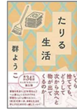
『たりのる生活』 群 ようこ/著