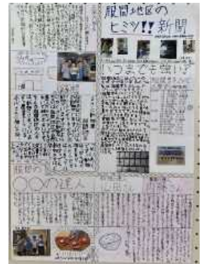
★銀賞★ 「服間地区のヒミツ!!新聞」(6年)