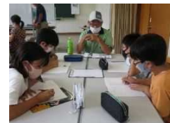
地域に出て取材 &インタビュー 頑張りました!