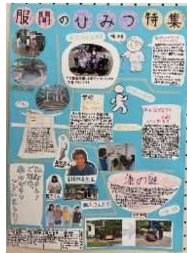
★銀賞★ 「服間のひみつ特集」(5年)