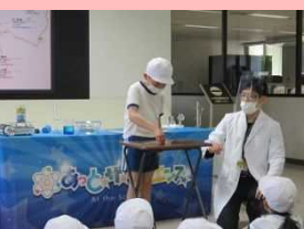
低学年・あっとほうむ