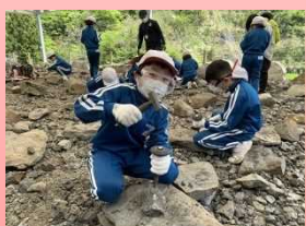
中学年・恐竜博物館