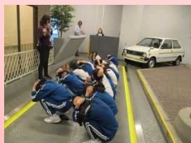
高学年・福井市防災センター・県子ども歴史文化館

低・中・高学年に分かれ、バスに乗って出かけました。晴天の中、子どもたちはいろいろな体験をして、楽しい1日を過ごしました。