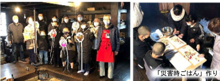
「災害時ごはん」作り