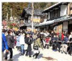
▲子どもたちによる藺玉飾り付け