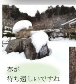
春が 待ち遠しいですね