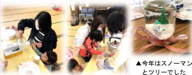
▲今年はスノーマンとツリーでした

1月11日(水)は、「スノードーム」を作りました。お母さんのお手伝いができる子は一緒に作り、まだ小さい子は一体何ができるのかワクワクしながら完成を待っていました♪