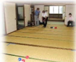
▲公民館2階和室で開催した時の様子