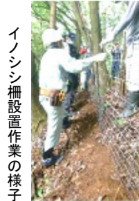
イノシシ柵設置作業の様子

11年前に佐山の東端から始まり、途方もない労力の末にイノシシ柵が西山の西端につながりました。遂に万里の長城が完成した気分です。