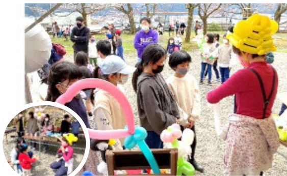
大活躍の「バルーンアートふろーと」さん！

スタンプラリー後の子どもたちへのお楽しみ企画は、バルーンアートプレゼント！長い列ができるほどの人気で、先生も大忙し！