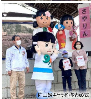
佐山姫キャラ名称表彰式