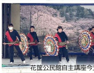
花筐公民館自主講座今立さくらの会