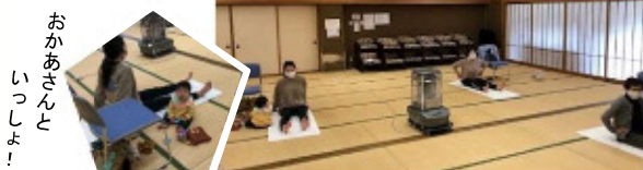
おかあさんと いっしょ！

3/19は、チェアバレトン教室の最終回でした。3回目ともなると、皆さん、指先まで意識され形も美しく、とても動きがよくなっていました。子どもさんを連れてのご参加があり、「子どもと一緒に参加させてもらって、嬉しかった。」と、喜んでいただけました。