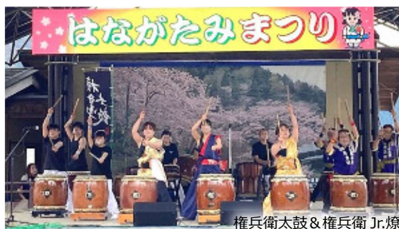
権兵衛太鼓&権兵衛 Jr.療