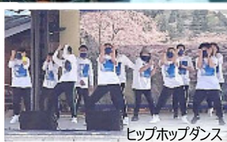
ヒップホップダンス