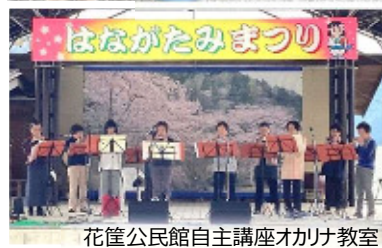
花筐公民館自主講座オカリナ教室