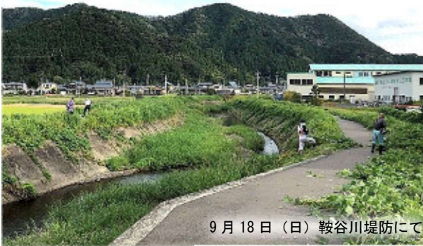
9月18日(日) 鞍谷川堤防にて

秋の訪れを感じさせる9月の中旬に自治振興会、壮年会、区長会によるクリーンキャンペーンを実施いたしました。粟田部地区の河川敷沿い遊歩道周辺の草刈りを行いました。当日参加された皆さまお疲れ様でした。【粟田部壮年会】