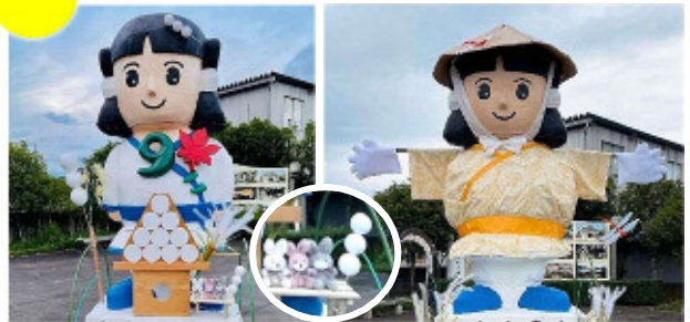
お月見おおとのん 案山子おおとのん