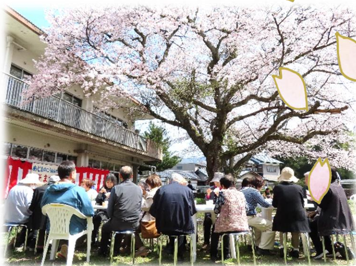
— 昨年の様子 —