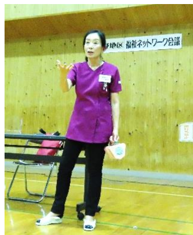
三上歯科衛生士による オーラルフレイル予防講習会

最後に味真野団地と池泉町の区長に町内福祉連絡会で話し合った内容の発表がありました。