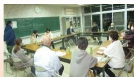
地域の青年たちと放課後子ども教室 サポーターさんの企画会議