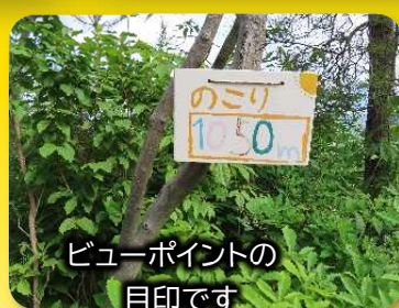
ビューポイントの 目印です

6 月 12 日 (日) 味真野自治振興会地域部主催で、「味真野地区壮年連絡協議会」、「のろし隊」の協力を得て、総勢 28 人で武衛山登山道整備を行いました。今回の整備では、登山道への階段設置、登山道・頂上付近の草刈り、雑木伐採を行いました。