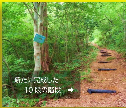
新たに完成した 10 段の階段 →