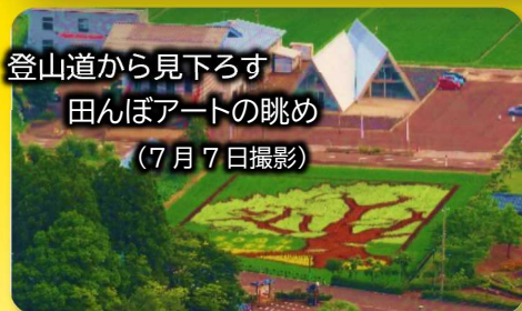
登山道から見下ろす 田んぼアートの眺め (7月7日撮影)