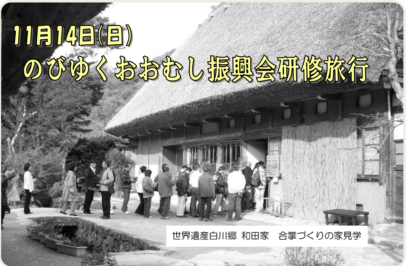
世界遺産白川郷 和田家 合掌づくりの家見学

研修旅行は、例年春に行なわれていましたが、今年は地区の最大イベントである大虫小学校創立100周年記念式典を行なう年ということで、関連のある自治振興会事業は、100周年の冠をつけ、記念式典の前に行なう計画にしました。研修旅行は式典後とし、地域の皆様に記念事業の慰労という趣旨で、呼掛けしましたところ多くの方々に参加いただきました。