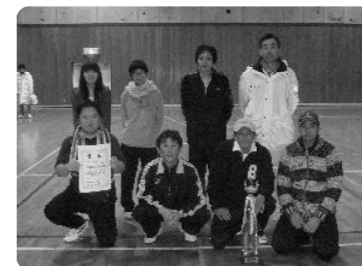
バドミントン大会 優勝：高森町A

12月12日(日)地区ソフトバレー大会、過去最高の18チームが参加、小学校、地区体育館で白熱した試合が行われました。優勝は、またも高森町A、2位大虫町A、3位丹生郷町と上太田町でした。