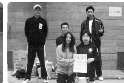
ソフトバレー大会 優勝：高森町A