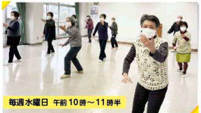
毎週水曜日 午前10時～11時半