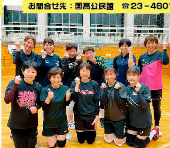
第1・3・5土曜日 午後7時30分～9時50分