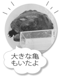
大きな亀もいたよ