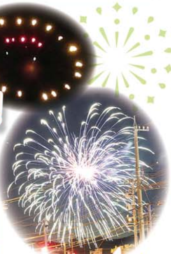
花火が上がりクライマックスも大盛り上がり...