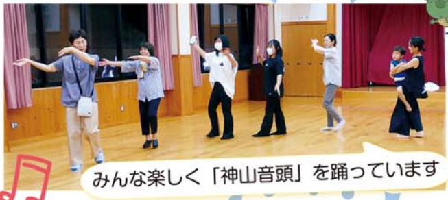
みんな楽しく「神山音頭」を踊っています