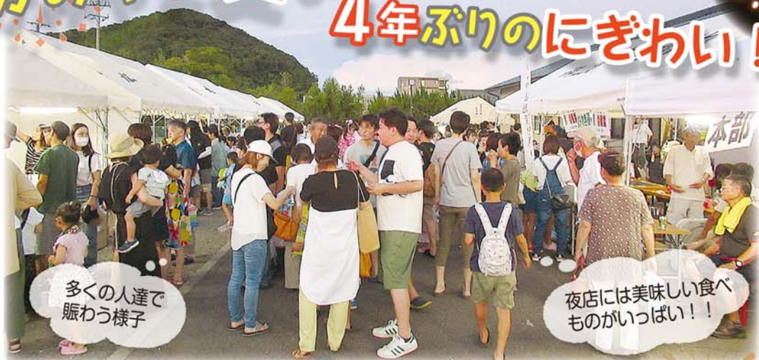
多くの人達で賑わう様子