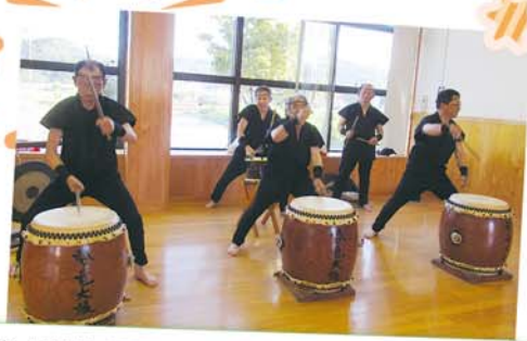
勢竜太鼓や日野ベンチャーズで盛り上がろう!