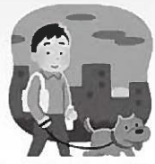
犬の散歩をしながら