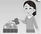
自宅周辺の花に水をやりながら