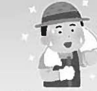
農作業をしながら