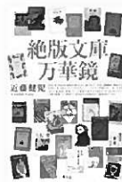
『絶版文庫万華鏡』 近藤 健児/著