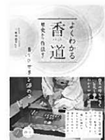
『よくわかる香道』 三條西 堯水/著