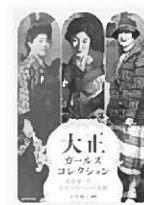
『大正ガールズコレクション』 石川 桂子/編著