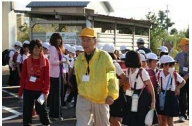
登下校時の児童見守り活動