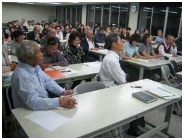
地域自治を考える公民館とまちづくり研修会