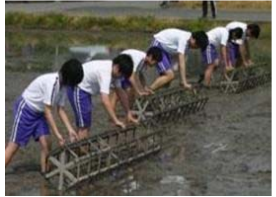
地域住民の協力の下で、古代米の田植え 米の栽培