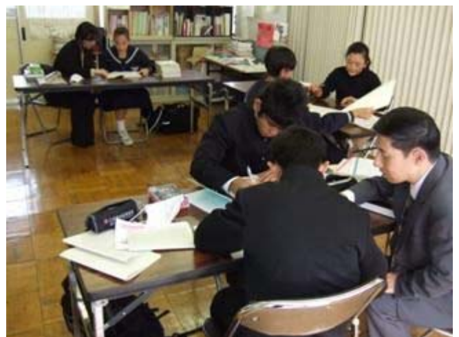
外国人児童生徒に対する日本語指導