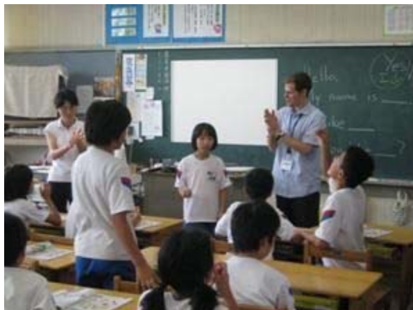
外国語指導助手（ALT）による外国語活動