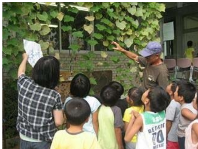
放課後子ども教室 (地域の方の指導でひょうたんづくり)