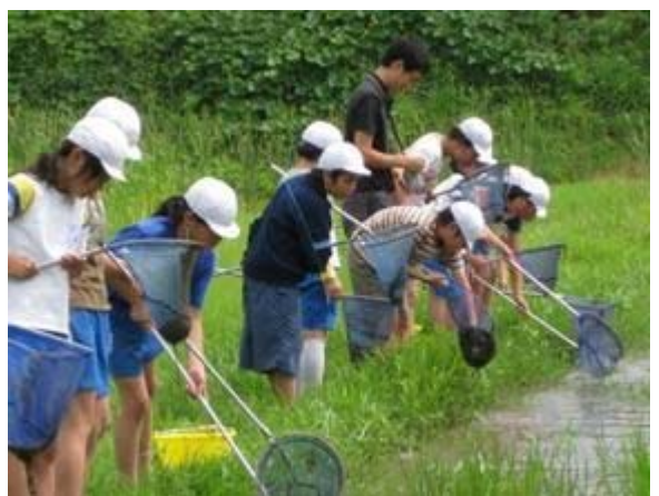
ピオトープ生物調査

さらに、自制心の低下や規範意識の希薄化、学習や生活に対して無気力な子どもの増加など