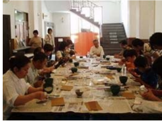
出土遺物の展示と遺物復元体験講座（武生公会堂記念館）