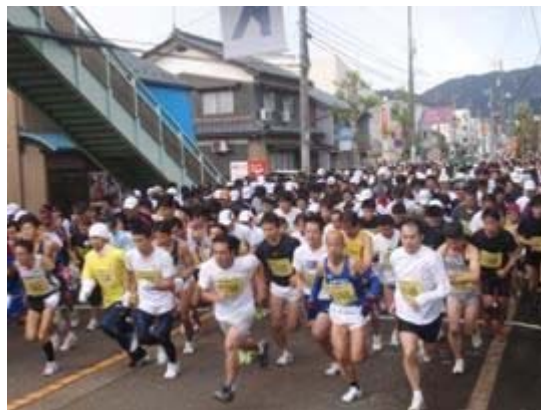
第28回 菊花マラソン大会