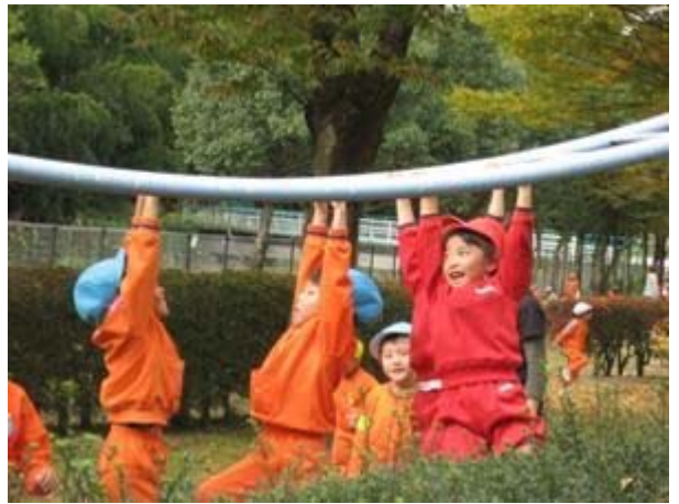
幼・保・小連携 なかよし交流会

今後は、多様化する幼児教育・保育のニーズに対し、既存の枠組みだけでは柔軟な対応が困難なことが予想されます。こうした状況に適切かつ柔軟に対応することが可能な新たなサービスを提供していくために、認定こども園制度の研究を進めていきます。