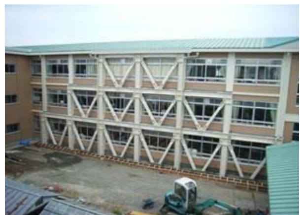
武生西小学校耐震工事

教育内容の特性を踏まえた学習活動、一人ひとりの子どもに応じた指導など、今日の多様な学習形態に対応するために、多目的に利用できる「オープンスペース」の導入を始め、断熱改修・自然エネルギーの導入等の「エコ改修」や「環境にやさしい工法」の多角的検討等を踏まえつつ、小・中・幼の学校施設の改築、大規模改造、施設・設備の改修を実施し、児童・生徒等が安全・安心で快適な教育環境の中で生活で