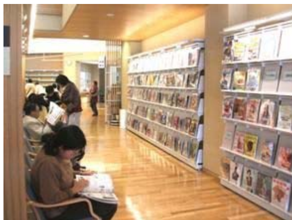
雑誌コーナー（中央図書館）