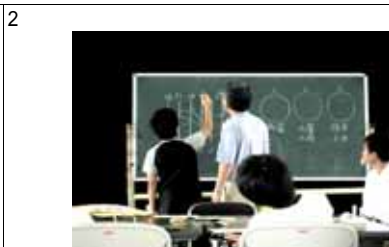
グループ分けを、アミダくじで行ないました。