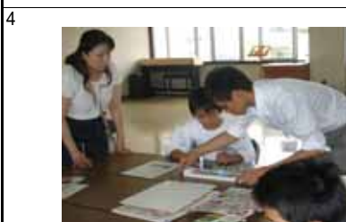
G キットを使って、広告でパイプ作りを教わってもらいます。

グループに分かれて、キットでパイプの作り方を教えてもらい、パイプ作りの練習です。また、パイプとパイプをつなぎ合わせるジョイントを牛乳パックを利用して作ります。緊張もほぐれてきました。