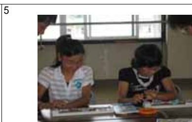
G すぐにパイプ作りをマスターしました。