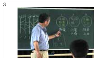
子供達と高専のお兄さん達とでG、G、Gの3つのグループが出来ました。