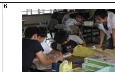
G どんどんパイプを作っています。