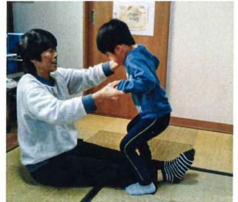
① 大人が足を開いて、子どもは足を閉じる