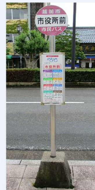
Ponto de ônibus Norossa