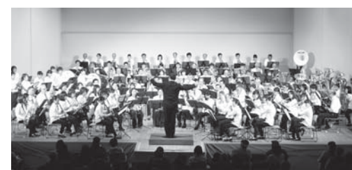
▲昨年の演奏会の様子