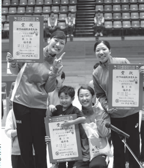
熱い戦いを繰り広げ、見事優勝を果たした成年女子エペの選手たち。