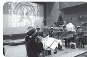
※昨年の演奏の様子

とき/12月8日(土) 午後2時 内容/「GLASSES(グラスサイズ)」によるオカリナの演奏を鑑賞します。 ★すてきなクリスマスメドレーをお楽しみください。