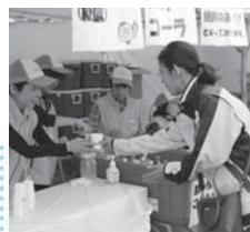
ドリンクサービスでは、ボランティアが来場者に笑顔で対応。越前市民の優しい人柄が伝わりました。

全国から一流の選手が集まり、目の前で高いレベルの試合を観戦できてとても刺激を受けました。また、地元選手への会場一体となった大きな声援にはとても感動しました。私自身もプレイヤーとして出場しましたが、大会を成功させるために多くの人たちが尽力してこられたことに本当に感謝しています。