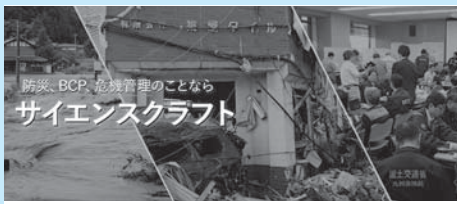
越前市から全国をフィールドに活躍！ 意欲ある人材を募集しています！ 株式会社サイエンスクラフト 越前市蓬萊町5-1 TEL.0778-21-1189 https://scraft.co.jp/