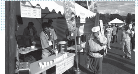
宮谷町おもてなし実行委員会の皆さん

地域の皆さんには、茶摘みや茶葉の仕分け作業などにも協力していただきました。会場では、味真野茶を飲んで「とてもおいしい」とたくさんの人に喜んでいただき、おもてなしができてよかったと思います。