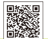
てんぐちゃん広場市ホームページ