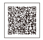
市民プラザたけふ市ホームページ