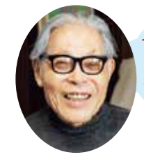
加古 里子 (1926~2018)