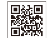
男女共同参画センター