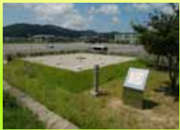
白鳳時代の寺院建築の跡であり、大虫本町及び郷土史会員による維持保存が成されています。