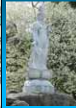
平成14年に山頂に建立された観音菩薩で近くには市指定天然記念物のキタコブシの大木があります。