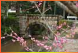
大正八年に築造され、 90年近く経っても綺麗な橋で文部省の登録文化財に指定されています。