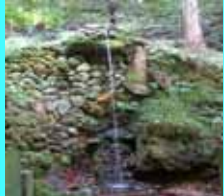
規模は小さいが、この水は川の流水ではなく湧水であり、飲用水として最適です。