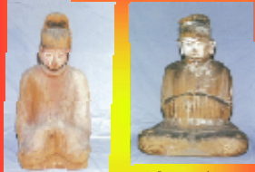
塩椎神 天津日高日子 穂々出見尊 国指定重要文化財