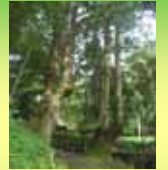
1200年前に泰澄大師が植えられた杉と伝えられ山頂の奥の院の山門となりました。